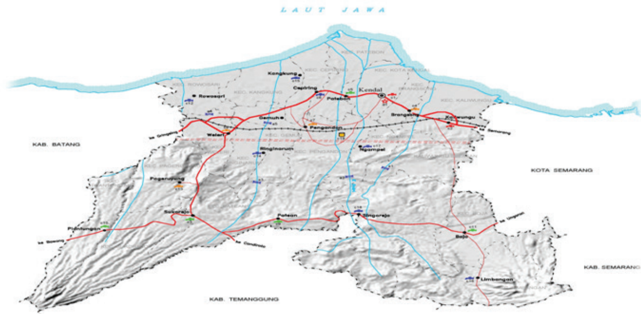
Gambar 1. Gambar Wilayah Kabupaten Kendal, Jawa Tengah

Tengah. Pemilihan lokasi dilakukan secara sengaja ( purposive ) dengan pertimbangan yaitu Kabupaten Kendal berbatasan dengan ibu kota Provinsi Jawa Tengah dan berdasarkan data dari sistem informasi pengelolaan Kartu Tani pada awal tahun 2018 telah mencatatkan pembagian Kartu Tani cukup besar yaitu sebanyak 51.005 peserta dari total 62.000 peserta atau sebesar 82,25 persen. Perkembangan tersebut cukup pesat dibanding 35 kota/kabupaten lain di Jawa Tengah. Namun demikian, realisasi penyaluran pupuk bersubsidi menggunakan Kartu Tani relatif rendah. Selain itu, sampai dengan saat ini juga belum pernah dilakukan penelitian dengan topik serupa di wilayah tersebut. Peta lokasi disajikan pada Gambar 1.